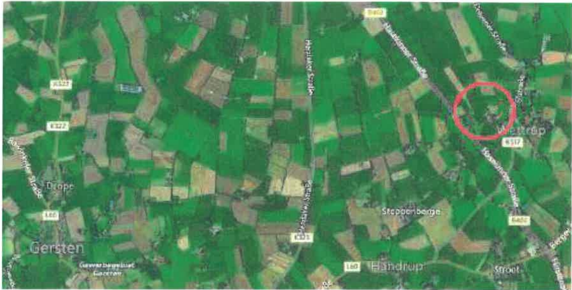
Abbildung 1: Lage des UG im räumlichen Zusammenhang