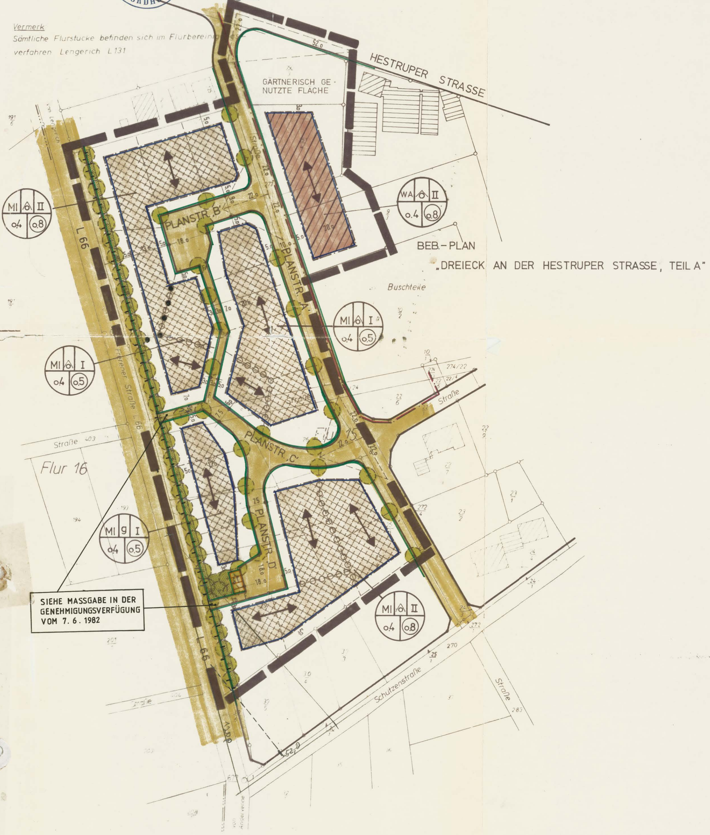
BEBAUUNGSPLAN NR. 6 „DREIECK AN DER HESTRUPER STRASSE, TEIL B“

Vermerk Sämtliche Flurstücke befinden sich im Flurbereinungsverfahren Lengerich L131